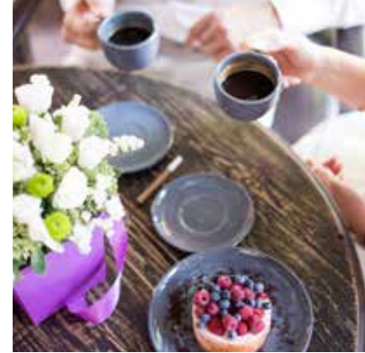
Ambulante Betreuung Begleitung und Hilfe im Alltag.