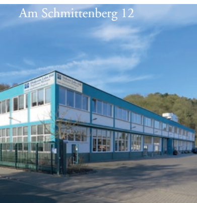
Am Schmittenberg 12

Parkplätze befinden sich vor den Gebäuden.